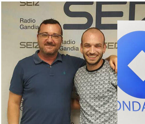
SER - JULIO 2022