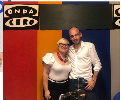
ONDA CERO - JULIO 2022