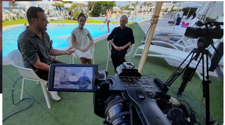
TELESAFOR - JULIO 2022