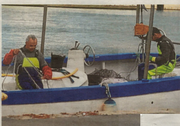
Dos pescadores realizan trabajos de mantenimiento en su embarcación en el puerto de Gandia.

En otros que en las cenas se se aplique en su costa y este ya en los 150 euros que en cuestión de días rebasa esta cifra y ya puede acercarse a los 180 o 200 euros el kilo. Este hecho que se hayan capturado menos especies, pero esto se traduce en aumento de precios de las especies que se venden en las lonjas habituales de los últimos años, precisaron desde la lonja.