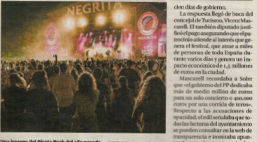
Una imagen del Pirata Rock del año pasado.

El PP revela una factura de 15.000 euros para el patrocinio del Pirata Rock del pasado verano