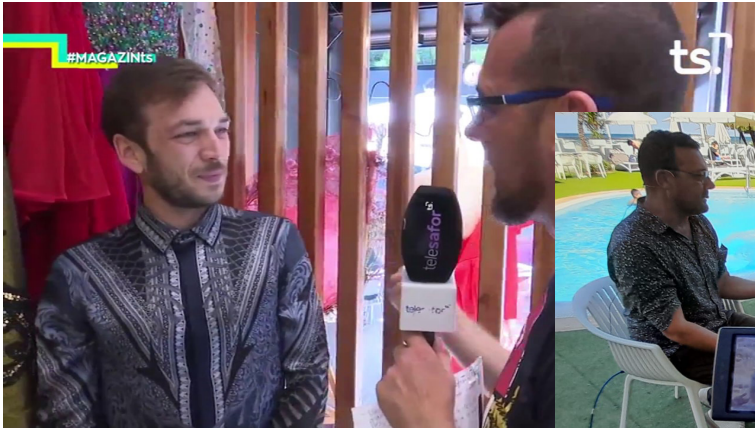
TELESAFOR - MAYO 2018