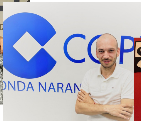
COPE - JULIO 2022